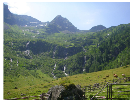
Blick zu den Wasserfällen