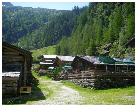
Putzentalm auf 1354m

Von der Breitlahnhütte wandert man in ca.45 min zum idyllisch gelegenen Schwarzensee, an dem ein schöner Rundweg angelegt ist. Danach steigt der breite Wanderweg ein wenig bis man in 30 min die Putzentalm erreicht hat, wo Schmankerln aus eigener Produktion am offenen Herd zubereitet werden und wo viele kleine Wasserfälle den Berg herunter brausen. Der Rückweg erfolgt dann auf dem selben Weg, wobei man am Schwarzensee nun auf der anderen Seite zurück zum Ausgangspunkt Breitlahnhütte wandern kann.