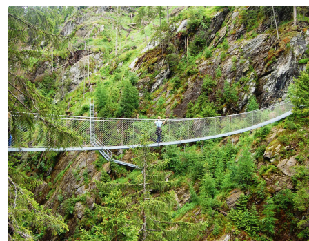
35m lange Hängebrücke