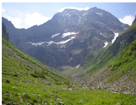
Schönster Talschluss Gollingwinkel

Vom Parkplatz im Untertal wandert man gemütlich auf der Forststraße im Talgrund des Steinriesenbaches, bis man zu einer Weggabelung kommt, hier geht es geradeaus weiter und kurz darauf rechts über einen Bach. Der Weg endet beim Materialaufzug der Gollinghütte, auf der Höhe eines Wasserfalles. Nun geht es in steileren Serpentinien bis zur Gollinghütte, in der man eine gemütliche Rast einlegen kann, vor oder nachdem man die restliche Strecke bis zum Gollingwinkel gewandert ist, dem wohl schönsten Talschluss. Nachdem man die ganzen sehenswerten Eindrücke genossen und festgehalten hat, wandert man auf dem Anstiegsweg zurück zum Ausgangspunkt. Andere Variante: Zum Abschluss über die Riesachfälle