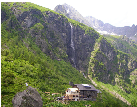
Die Gollinghütte auf 1641m