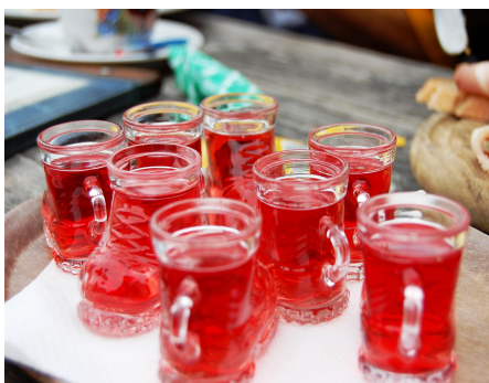
Zwischendurch a guats Schnapsal...