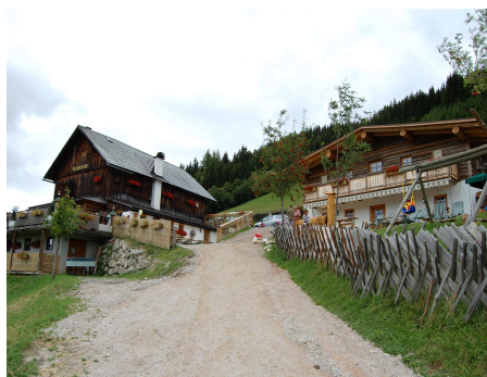
Die Sonnenalm auf 1247m