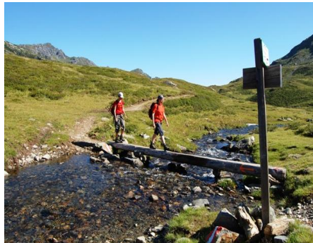
Bei den Giglachalmen