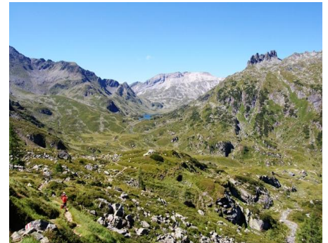
Giglachseen mit Lungauerkalkspitze