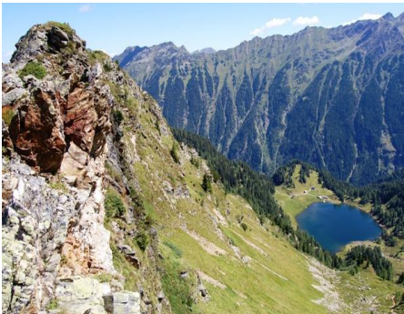
Duisitzkarsee im Obertal

Von der Holdalm, 1062 m, wandern wir über die Lackner Alm auf dem Weg 776 vorbei beim Knappenkreuz, über die landschaftlich sehr reizvoll gelegenen Giglachsee-Almen, 1887 m, zum Giglachsee. Ein kurzes Stück am selben Weg zurück, führt unser Wanderweg nun rechter Hand der Giglachsee-Almen auf den Murspitzsattel, 2013 m, von dem man den Blick auf den wunderschönen Duisitzkarsee genießen kann. Von dort trennen uns knapp 400 Höhenmeter Abstieg vom See, an dem wir eine gemütliche Rast einlegen. Der Rückweg erfolgt über die Eschachalm bis zum Wandertaxi in ca. 1,5 Stunden. Gesamtzeit ca. 5-6 Stunden