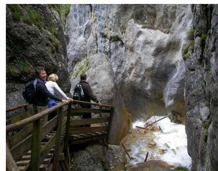
Weg durch die Silberkarklamm