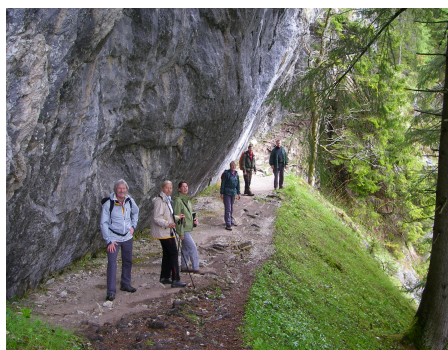
Streckenabschnitt am Höhenweg

anfangs gleichmäßig steigender Waldwanderweg über Wurzeln und Steine der zum teil mit seilen gesichert aber ohne weitere schwierigkeiten begehbar ist. Zwischendurch genießt man eine schöne Aussicht auf Rössing, die Niederen Tauern und in den Kessel der Silberkarklamm. Nachdem man sich in der Silberkarklamm auf 1223m gestärkt hat geht es nun auf dem Heinrich Pilz Weg, der wiederum durch den Wald führt Richtung Tal. Danach quert man das Schotterfeld, vorbei beim Schleierwasserfall zur Wildwasserklamm die durch viele Holztreppen und Geländer gesichert ist. Im Tal angekommen wandert man über das Gasthaus Fliegenpilz noch ca. 30 min zurück zum Ausgangspunkt.