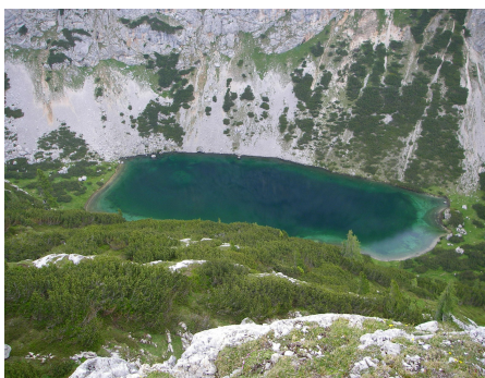
Blick zum Seetalsee (Silberkarsee)