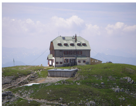
Das Guttenberghaus auf 2147m

Vom Hotel Feisterer führt der Weg in einigen Kehren in das „Tiefkar“ hinaus. Nach ca. 45 Minuten erreicht man die Lärchbodenalm. Danach wird der Forstweg durch einen alpinen Steig abgelöst. Bei der „Fischermauer“ wandert man direkt an den Felsen entlang, dann windet sich der Steig zwischen den grünen Hügeln des „Tiefkars“ dem Guttenberghaus entgegen. Ab hier bewegen wir uns in hochalpinem Gelände. Nun geht's hinter dem Sinabell und der Wasenspitze vorbei bis zur Abzweigung in Richtung Silberkar hinunter. Weiter hinab geht's entlang von wilden Wasser und kleinen Wasserfällen zur Jausenstation Fliegenpilz. Von hier gelangt man auf einem Waldpfad wieder zurück zum Ausgangspunkt.