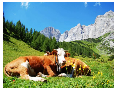
Abstieg von der Südwandhütte