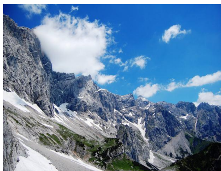
Blick vom Tor zur Südwandhütte

Von der Bachalm geht's über einen Steig der durch den Lärchenwald in das Windlegerkar ansteigt. Weiter von einer mit wildem Schnittlauch bewachsenen Stelle knapp oberhalb der Baumgrenze in der Karmitte durch eine kurze Latschenzone gerade ansteigend, wendet sich der Steig beim untersten Sporn des mächtigen Torstein-Südwestgrates nach rechts zum Tor hin. Diesen Felseinschnitt zwischen Torstein und Raucheck überschreitend gelangt man nach ca. 200 Höhenmeter Abstieg in den Torboden hinab und weiter über die flache Geröllhalde unterhalb des mächtigen Südbabsturzes zur weithin sichtbaren Südwandhütte. Von dort geht es weiter zur Glösa-Alm und über die Luxwiesn zurück zum Ausgangspunkt.