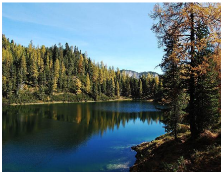
Grafenbergsee unterhalb der Alm

Vom Parkplatz am Stoderzinken gehen wir zur Brünnerhütte (Weg Nr. 675), dort zweigt der Weg links ab. Nun geht es das erste Wegstück ständig leicht bergab durch den Lärchenwald, danach wieder leicht bergauf bis zum ersten Blick auf den Ahornsee. Nur ein paar Minuten weiter zweigt links ein Steg zum Ahornsee ab, wir wandern jedoch auf saftig grünen Almwiesen weiter auf dem Weg Nr. 618 zur Grafenbergalm und genießen die ersten Ausblicke auf den Kufstein und das Dachsteingebiet. Von hier geht es weiter bergab (Weg Nr. 668). Bereits nach wenigen Minuten erreichen wir den Grafenbergsee. Nach einem weiteren kurzen Abstieg sind wir am schön gelegenen Ahornsee angelangt, an dem wir nochmals eine Ras