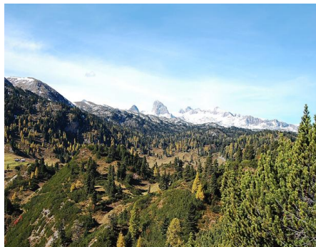
Blick richtung Dachstein