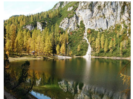
Ahornsee unterhalb des Grafenbergsees